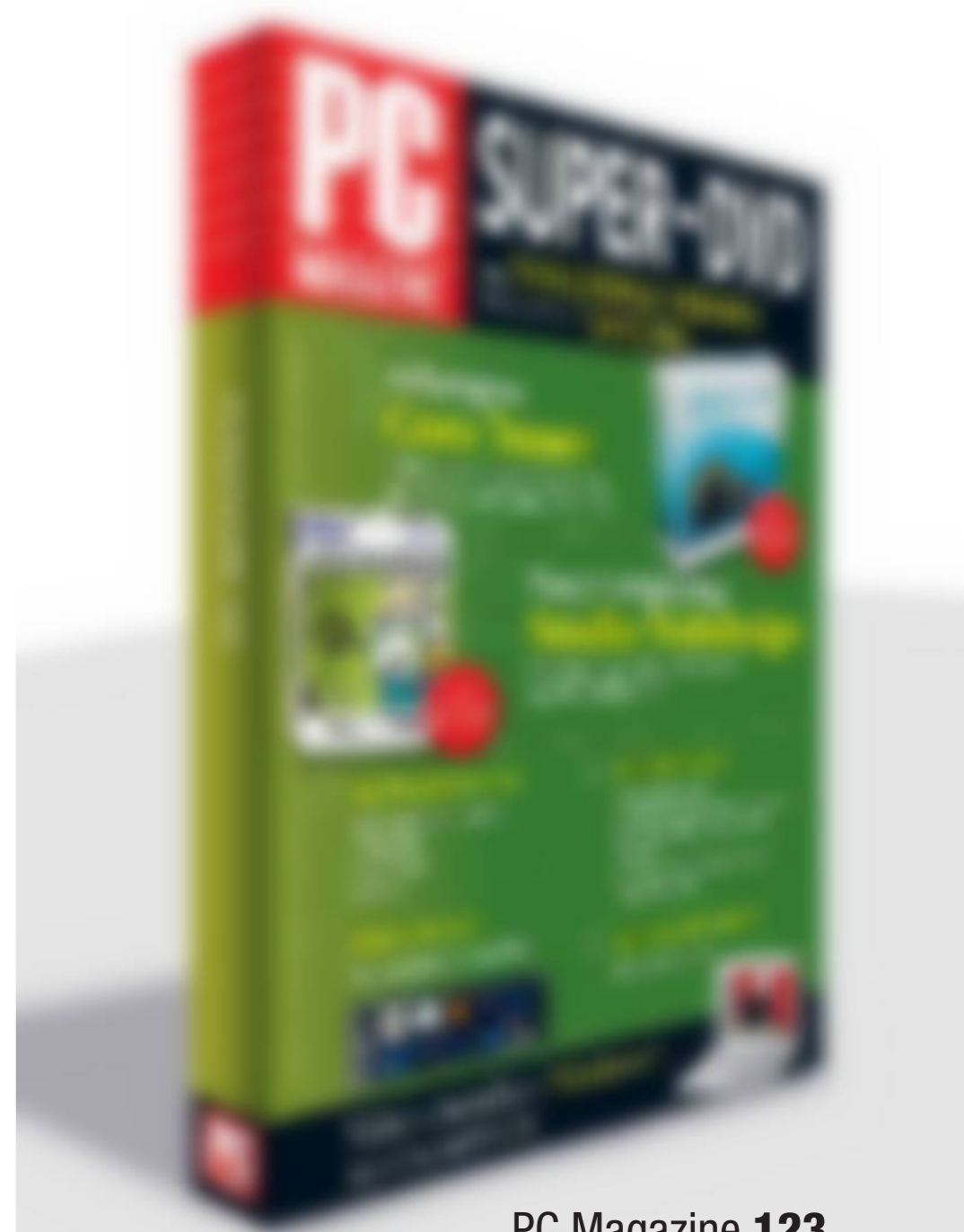
PC Magazine 123 Met extra DVD

PC Magazine is één van de weinige maandbladen die nog waardevolle software bundelt op een dvd. Deze keer krijg je maar liefst twee volledige applicaties. Zo kan je met Core Tuner van Ashampoo Windows eindelijk optimaal gebruik maken van die dure multicore-processor. Dit pakket vertegenwoordigt een winkelwaarde van 19,99 euro. Maar er is meer: in samenwerking met Easy Computing biedt PC Magazine je de volledige versie van Studio Webdesign aan. Een professioneel ogende website in elkaar steken was nog nooit zo makkelijk. Niet te missen!